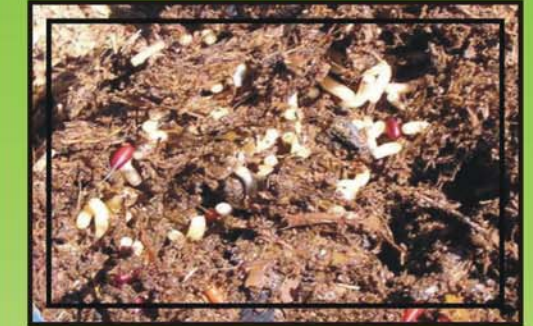
Larvas y pupas en el estiércol.

Sólo el 15 % de las moscas existen como moscas adultas. El otro 85 % están ocultas en sus áreas