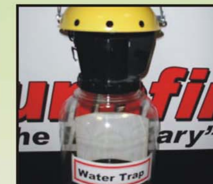
Trampas Basadas en Olor de Feromona