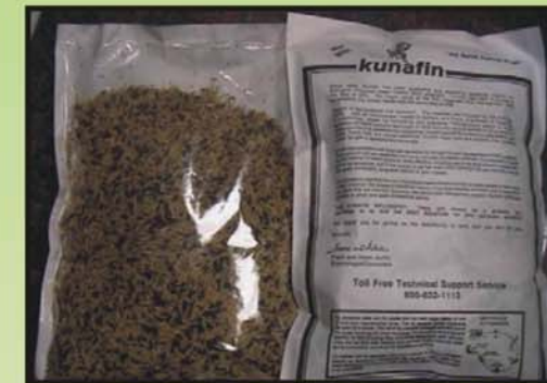
Kunafin Fly Parasite Pouches

La Naturaleza siempre ha mantenido un equilibrio entre la población de especies por medio de enemigos naturales, la distribución de alimento, desastres naturales, etc. Los desequilibrios son generalmente temporales a menos que los mecanismos naturales sean interrumpidos por las actividades del hombre. Al congregarse artificialmente grandes números de animales en una sola área, o al plantar demasiados acres de un cultivo en particular, permitimos que se acumulen números inusuales de plagas de insectos que se favorecen bajo estas condiciones. Kunafin simplemente aprovecha los depredadores de la naturaleza y los parásitos al producirlos y liberarlos en combinación con un uso SELECTIVO de herramientas tales como carnadas, trampas, residuales y otras prácticas culturales probadas. ¡Kunafin se trata de estrategia! Nosotros personalizamos el programa para que se acomode a las necesidades del cliente. ¡Esta es la UNICA manera en que un manejo efectivo de plagas de insectos puede ser mantenido a LARGO PLAZO! El manejo biológico integrado de plagas es científicamente probado y con la mejor relación costo-beneficio.